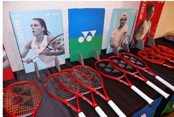
新製品 V コア展示