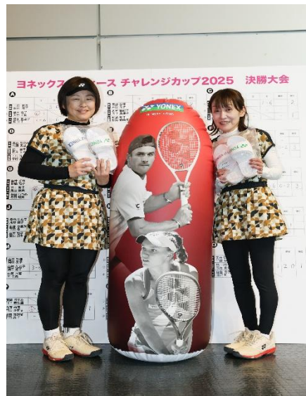
ベストドレッサー賞