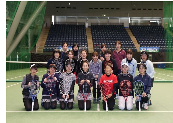
チャレンジマッチ